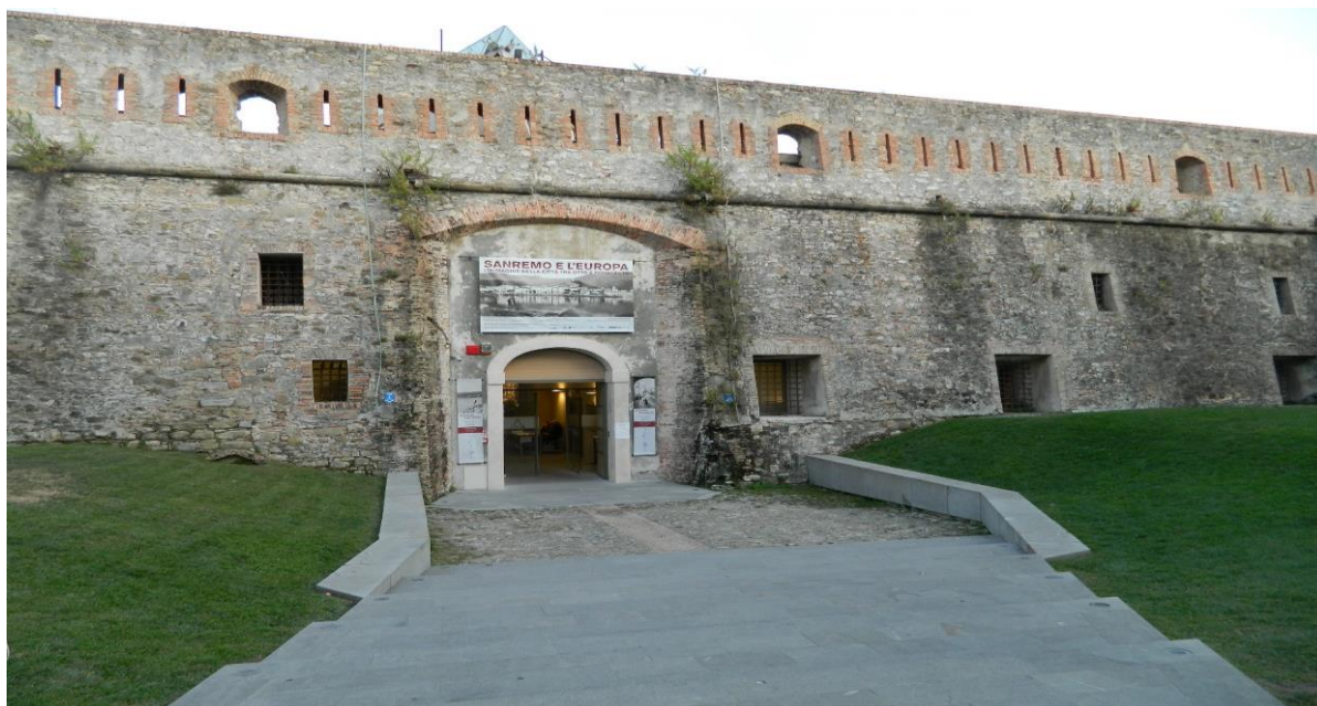
Forte di Santa TECLA

Corso Nazario Sauro 7, Porto Vecchio- 18038 Sanremo (IM)